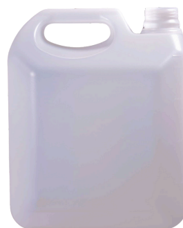
1 Galón (3,785 litros)