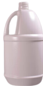
1 Galón (3,785 litros) 38 mm

Recipientes fabricados con materia prima recuperada, aptos para empaque de líquidos no corrosivos o químicos menos fuertes