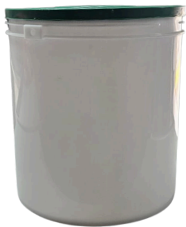
Galón (3,785 litros)