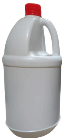
Medio Galón Circular