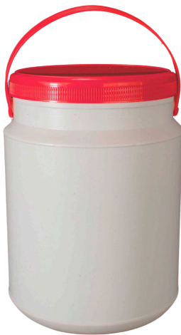
2 litros Tapa 123mm