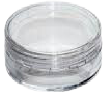
Caja Cristal 10 gr