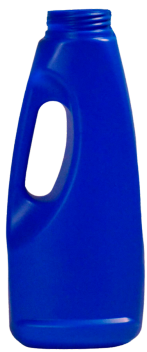
1 Litro 48mm Oval Dosif