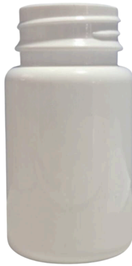
90 ml liso