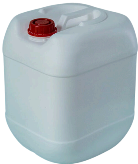
Bidón bajo 20 lts- 1kg