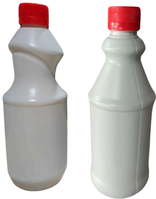
Clorox 500 cc