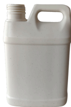
1/2 litro (500 ml)