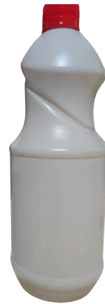
Clorox 1000 cc