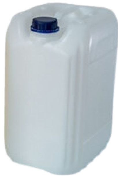
Bidón alto 20 lts- 1kg

Recipientes que permiten un fácil manejo, alta resistencia al impacto y apto para productos químicos, aceites, lubricantes y aditivos