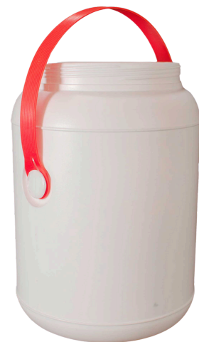
4 litros Tapa 127mm

Recipientes aptos para el envasado de productos de aseo, Ideal para contacto Humano, Otras Aplicaciones, Químicos, Veterinarios