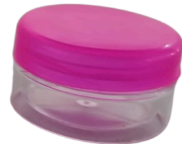
Caja 5 gr Rosca