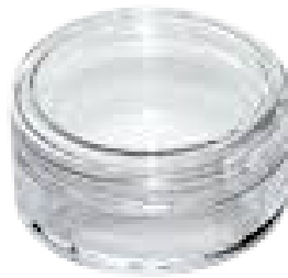
Caja Cristal 5 gr