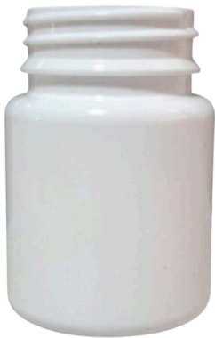
60 ml liso