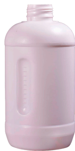
1 Litro Tapa 38mm