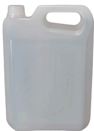
1 Galón (3,785 litros)