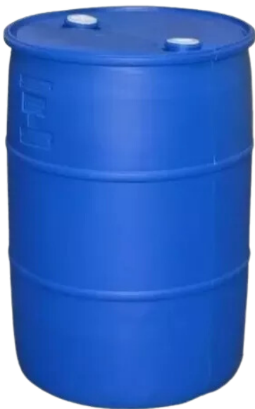
Tambor Anillo Integrado