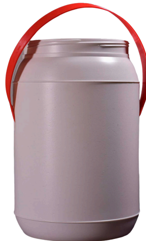
3 litros Tapa 127mm