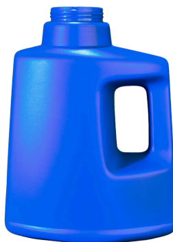
3 Litros 65mm Oval Dosif