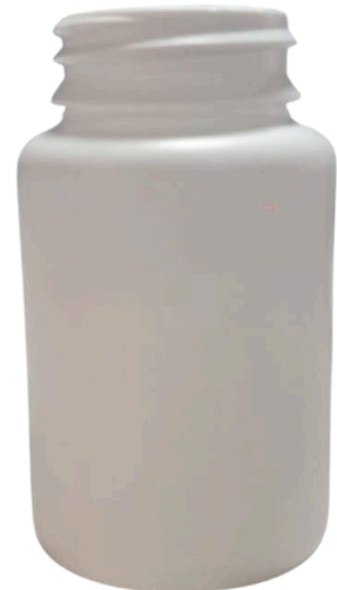
110 ml liso