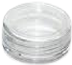
Caja Cristal 3 gr