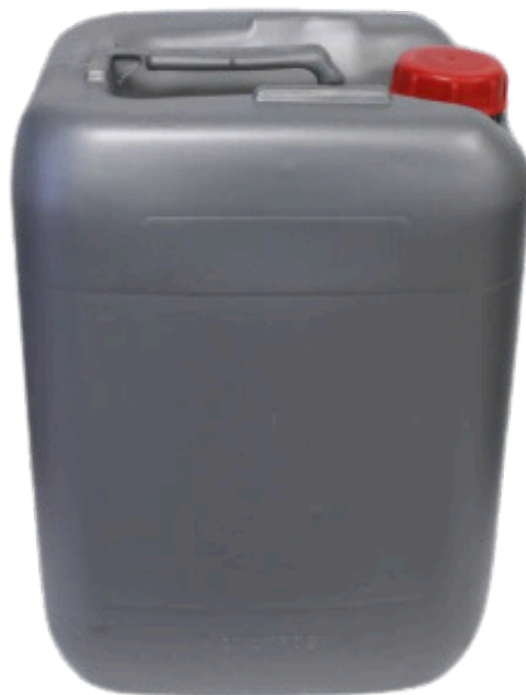
Bidón 20 lts- 1kg

Recipientes que permiten un fácil manejo, alta resistencia al impacto y apto para productos químicos, aceites, lubricantes y aditivos