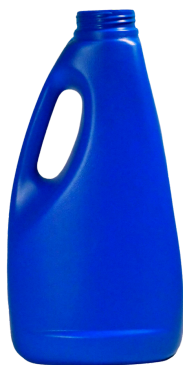
2 Litros 48mm Oval Dosif