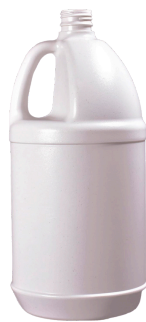
1/2 galón (1,9 litros) 28 mm