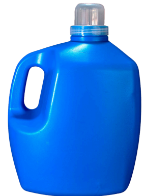
5 Litros 65mm Oval Dosif

Recipientes aptos para el envasado de productos de aseo, detergente o suavizantes